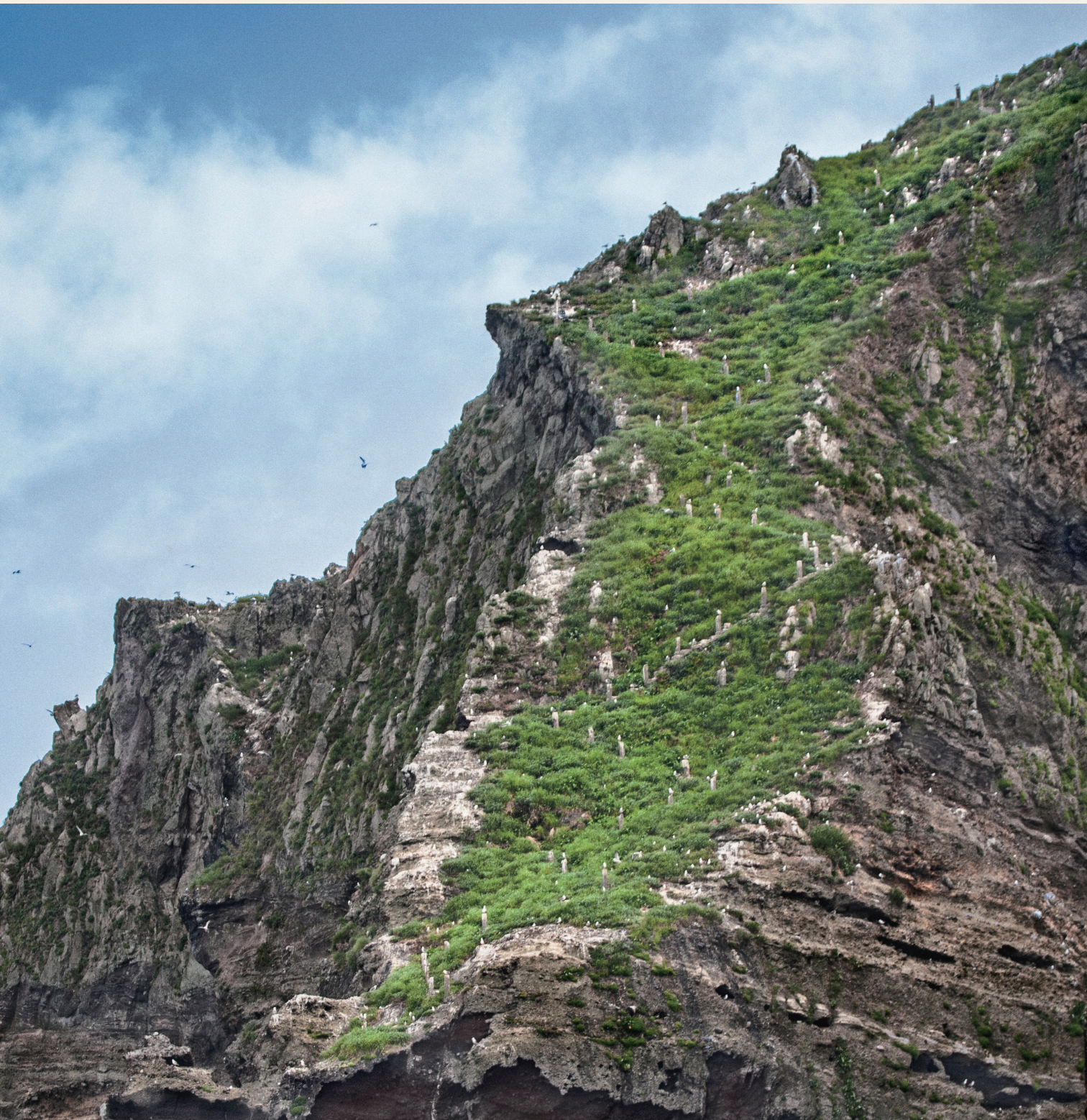
金重晚_金正浩跟随