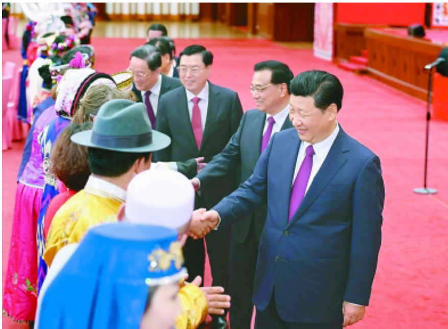
시진핑 국가주석과 소수민족 대표들 중화민족공동체는 현대 중국의 영토와 역사 안으로 주변민족들을 병합하기 위한 이론적 바탕이다

2022년 7월 13일 시진핑(習近平) 국가주석은 ‘중화민족공동체’ 의식을 견고히 하는 일을 민족 업무의 ‘강령’으로 삼고, 각 대학교는 ‘중화민족공동체’에 관한 연구를 심화시켜 학생들의 국가관, 역사관, 민족관, 문화관, 종교관 등을 정확하게 수립해야 한다고 강조했다. 2022년 10월 제20차 당대회에서도 ‘중화민족공동체론’이 언급되었다. ‘중화민족공동체’란 현 중국의 주류 민족인 한족은 물론 소수민족까지 포함하는 광역의 개념으로 각 민족이 교류와 동화를 통해 하나로 융합한 실체를 뜻한다. 현대 중국의 부상과 함께 주목받는 이 개념의 기원은 중국공산당이 탄생하기 전으로 거슬러 올라가야 한다.