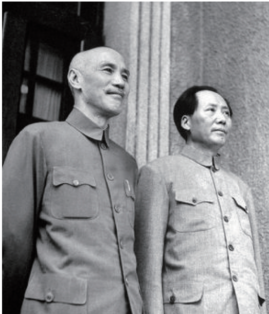
장제스와 마오쩌둥 중국 현대사의 두 걸목은 서로 표현 방법은 상이했어도 중화민족이라는 의식 자체는 분명히 공유하고 있었다.

푸쓰넨(傅斯年) 2 은 변강에 거주하는 민족들과 그들의 역사를 중국사에 포함시키며 이 주장의 타당성을 입증하려 했다. 그는 한반도와 만주 지방에 대해 고대 중국은 이곳에 거주하는 동이(東夷)와 동류의식이 있었고, 한무제(漢武帝) 이래 중국인의 진출과 확장이 거듭되어 대대로 지역의 군장으로서 통치해 왔다고 주장했다. 즉, 항일전쟁 시기 ‘중화민족’에 대한 의식은 량치차오가 창안한 대민족주의 개념에서 국토에 대한 인식이 유독 크게 돌출된 영토 민족주의의 형태로 나타났으며 조선, 베트남, 태국, 버마 등 과거 조공국들까지 민족국가 중국의 영토에 포함시킨 것이다. 현대 중국의 ‘변강학(邊疆學) 3 은 바로 이 영토 민족주의의 계승이다.