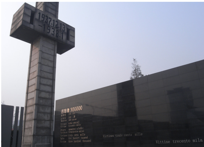
난징시에 있는 난징대학살기념관

사를 개최하고 특정 기관을 설치하여 전쟁 종결에 대한 새로운 해석을 보급해 나가고자 했다. 이러한 중화인민공화국 정부의 대응 방법은 2010년대를 전후하여 다시금 강화된 형태를 띠었다. 중국 정부는 2014년부터 승전을 기념하는 날을 법정기념일로 승격시켜 전국적 규모의 기념행사를 진행했다. 또한 같은 해부터 12월 13일을 난징대학살 희생자 국가 추모일로 지정하고, 대학살을 기억하는 대규모 전시관을