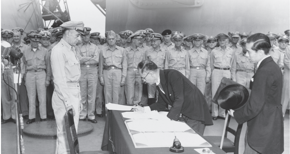
1945년 9월 2일 일본 항복문서에 서명하는 시게미쓰 마모루 외무상

제2차 세계대전은 1945년 8월 15일 일본의 항복으로 끝이 났다. 이 사건은 세계사에 하나의 변곡점을 만들었고, 이후 새로운 역사가 전개되었다. 그리고 전쟁을 끝낸 이 사건은 동아시아 각 나라에서 개인의 기억이라는 차원을 넘어 집단의 기억을 이루게 되었다. 그리하여 남북한을 비롯해 중국과 일본 등 동아시아 여러 나라는 저마다의 방식으로 이날을 ‘특별히’ 기억하며 기념하고 있다.